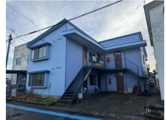
施設名: 藤和ホーム桂 住所: 釧路町桂2丁目5-17 家賃: 30,000円 水光熱費: 実費負担