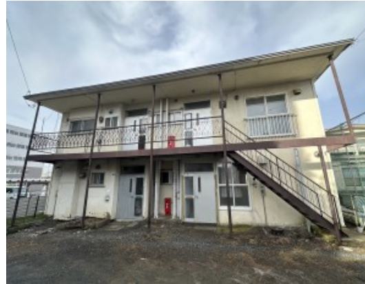
施設名: 藤和ホーム堀川 住所: 釧路市堀川町3-25 家賃: 30,000円 水光熱費: 実費負担