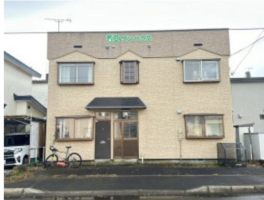
施設名: 藤和ホーム若草 住所: 釧路市若草町8-14 家賃: 30,000円 水光熱費: 実費負担

～「安心」「安定」「自立」を第一に考え、自らの意思で選び・生活し・成長できる環境を～